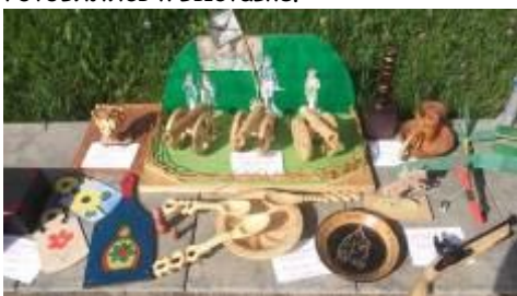
Интересные технические разработки

1 июня в г. Михайловске на площади Ленина состоялась выставка технического и декоративно-прикладного творчества, приуроченная к Международному дню защиты детей. В выставке принимали участия 14 школ Шпаковского муниципального района и учреждения доп.образования г. Михайловска. Работы, выполненные учащимися, были представлены по 13 номинациям. Все школы достойно подготовились к выставке.